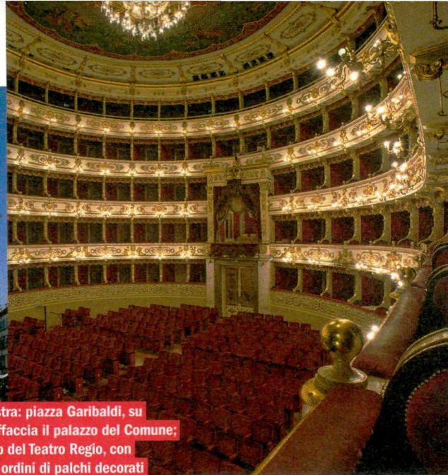
Da sinistra: piazza Garibaldi, su cui si affaccia il palazzo del Comune; l'interno del Teatro Regio, con quattro ordini di palchi decorati con stucchi dorati e ricchi drappaggi.