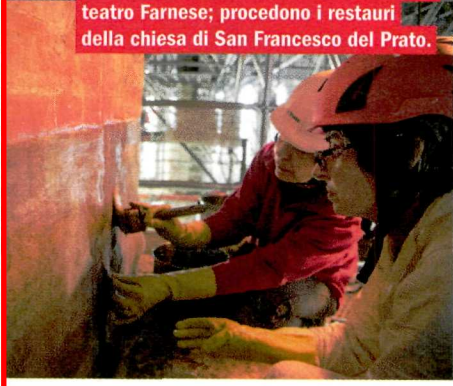
Dall'alto: l'interno ligneo del secentesco teatro Farnese; procedono i restauri della chiesa di San Francesco del Prato.

ca, pensata per ospitare gli spettacoli alla corte dei duchi, in una quinta scenica in legno e stucco che simulano marmi e metalli preziosi.