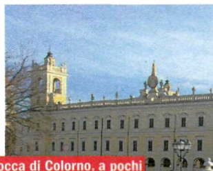
La Rocca di Colorno, a pochi chilometri da Parma, fu residenza di Maria Luigia d'Austria.

nella pietra, circondato da formelle policrome raffiguranti animali. A 20 metri d'altezza i ponteggi mi regalano una veduta di Parma nella quale, oltre i tetti, si profilano il fianco della cattedrale e la cupola del celebre battistero. Poi le guide mi fanno notare che fra i rondoni del sottotetto gli uccelli continuano a nidificare, nonostante i lavori in corso, e nelle navate laterali si scorgono le tracce delle celle ottocentesche per i detenuti (per prenotazioni: www.sanfrancescodelprato.it ).